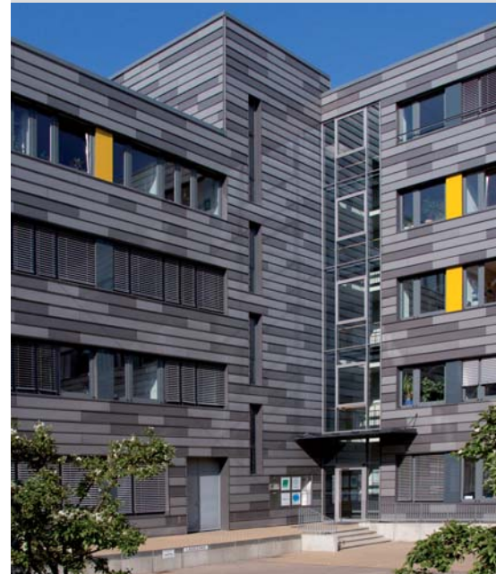
Die HFH am Hochschulstandort Hamburg